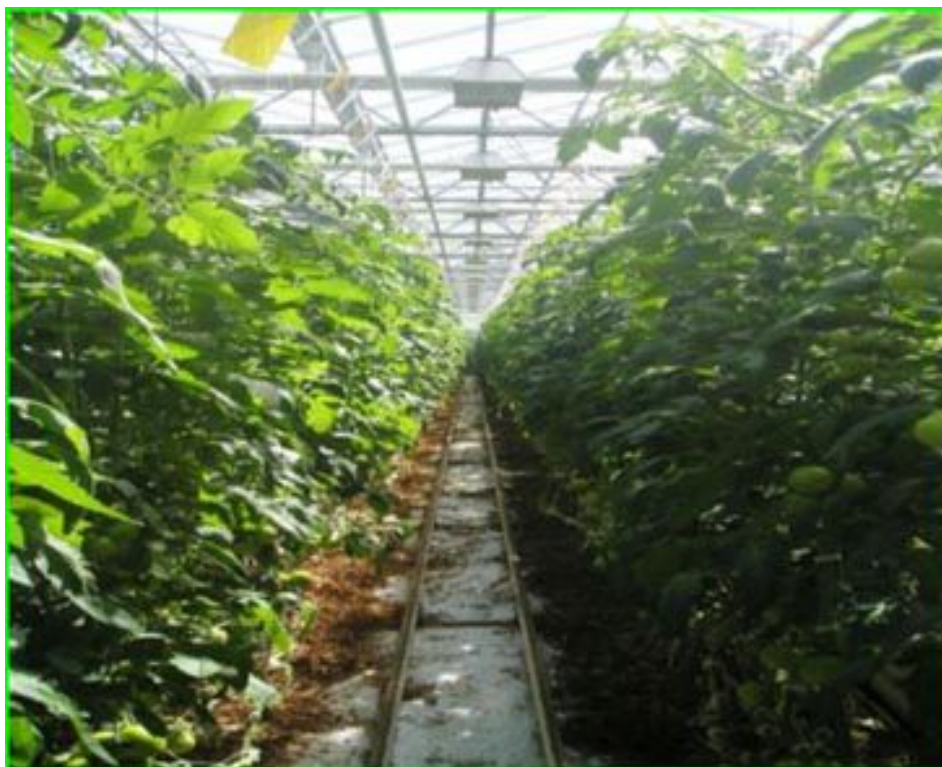
Photo 13 : dispositif à gauche de l'allée, les plants avec Hexahédon et à droite les plants avec l'eau de la ville :

Il n'y a pas de différence de durée de conservation des fruits entre le témoin et la parcelle avec Hexahédon. Les fruits étaient de même couleur et de même fermeté. L'affaissement des épaules était la même après 14, 26 et 34 jours de conservation en chambre froide à 15 °C.