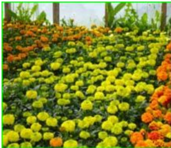
Floraison Marigold avec Hexahédon