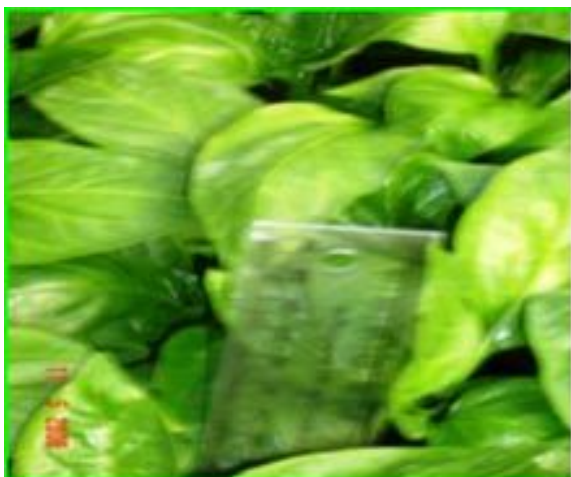
Tuteur : Piment avec Hexahédon 999