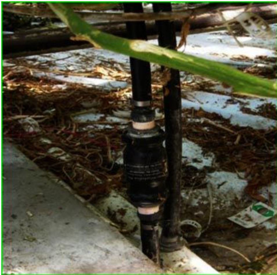
Photo 1 : modèle (Hexahédon 999) fourni par Bio-Mar Inc. aux différents producteurs pour les fins du projet.